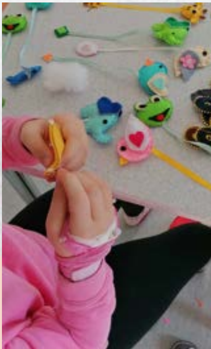
Ustvarjanje v bolnišničnem oddelku

Šola bo vključena v republiško tekmovanje »Tekmujemo za zdrave in čiste zobe«