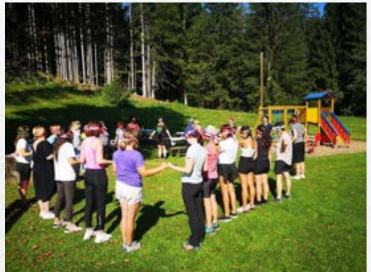
Poglabljanje timskega sodelovanja, avgust 2024