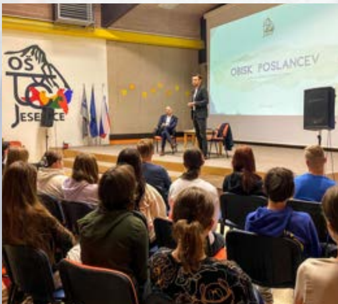
Poslanca državnega zbora na obisku v naši šoli