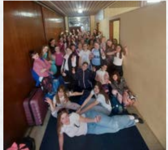
Učenci izbirnega predmeta ples