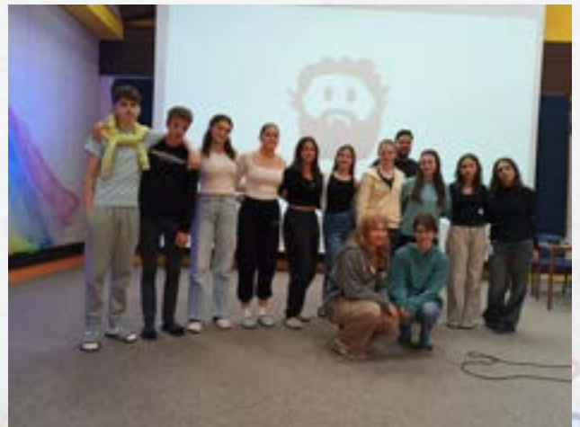
Zlati bralci na prireditvi bralne značke

Le-to bomo uresničevali vsakodnevno (v času vzgojno-izobraževalnega proces), poudarek bo tudi na različnih rednih urah pouka, urah oddelčnih skupnosti ter tudi znotraj različnih dejavnosti na šoli (v okviru dni dejavnosti). V okviru različnih projektov učenci spoznavajo sebe, so do sebe in okolice kritični, razumejo in sprejemajo drugačnost, znajo biti spoštljivi tudi do sveta okrog sebe (skrbijo za druge, si pomagajo, skrbijo za okolje v sklopu očiščevalnih akcij, ločujejo odpadke, so pri potrošnji varčni ipd.). S to prednostno nalogo so povezani tudi cilji letošnjega projekta Erasmus+ z naslovom Odpri srce in razširi obzorja .