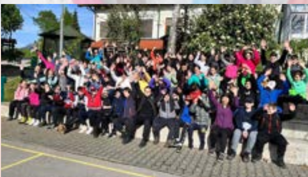
Učenci v šoli v naravi v Gorenju, 7. razred

Učenci 5. razreda bodo izvedli šolo v naravi v Pineti na Hrvaškem od 9. 9. 2024 do 14. 9. 2024. V poletni šoli v naravi bodo učenci obnovili ali pa usvojili veščine plavanja, spoznali rastlinstvo in živalstvo primorskega sveta ter imeli možnost za različne športne in družabne aktivnosti. Druge vsebine: pohodi, športno-družabne igre, ustvarjanje in koristno preživljanje prostega časa.