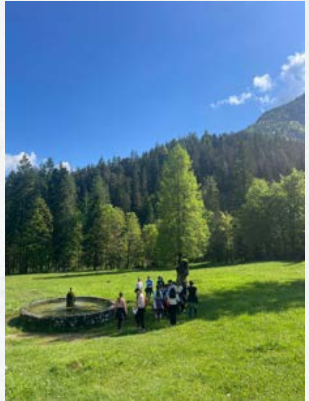
Tabor za nadarjene učence v Kranjski Gori

Pomembno področje svetovalnega dela je tudi področje poklicne orientacije. Dejavnosti, vezane na to področje, zajemajo poklicno svetovanje učencem in njihovim staršem, predavanja za starše in učence, obiske srednjih šol in drugih ustanov, del te vsebine pa je vključen tudi v redni vzgojno-izobraževalni program osnovne šole. Vsako leto drugi petek v januarju organiziramo poklicni sejem na naši šoli, udeležba srednjih šol iz bližnje okolice je vedno visoka.