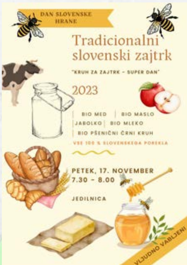
Vabilo na tradicionalni slovenski zajtrk

Na šoli se že kar nekaj let trudimo, da bi imeli učenci na voljo čim več lokalno in ekološko pridelane hrane. Zato redno in uspešno sodelujemo z nekaterimi kmetijami in s Kmetijsko zadruogo Šaleška dolina. Z nakupom lokalno pridelane hrane pomembno prispevamo k razvoju podeželja in zmanjšanju onesnaževanja zaradi transporta. Večina sadja, ki ga imajo učenci vsakodnevno na voljo za malico, je pridelanega na ekološki način. Prav tako mnogi mlevski izdelki (ješprenj, prosena kaša, pirin zdrob), med, marmelada, večina kruha in pekovskega peciva in še kaj. O ekološki pridelavi hrane se veliko pogovarjamo tudi pri predmetu gospodinjstvo in s tem z več vidikov prispevamo k promociji trajnostnega kmetovanja in učence spodbujamo k temu, da postanejo odgovorni potrošniki. Piščančje meso, mleko in mlečni izdelki, ki niso ekološki, pa so vseeno zelo kakovostni, skoraj vsi nosijo označbo za višjo kakovost – Izbrana kakovost Slovenija.