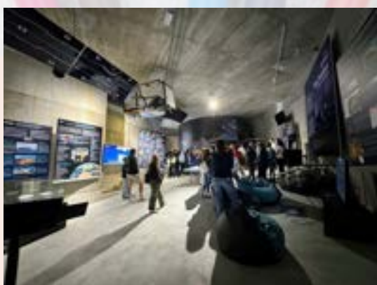
Mladi raziskovalci zgodovine

Prometne aktivnosti so posebej intenzivne v prvih dneh novega šolskega leta. Pri tem z gledno sodelujemo s policijo, redarstvom in Svetom za preventivo in vzgojo v cestnem prometu, ki vsak dan dežurajo na križišču ob vhodu v šolo z glavne ceste in pri semaforiziranem prehodu za pešce. Z njimi sodeluje vodstvo šole. Prometna aktivnost je tudi ena izmed letošnjih prednostnih nalog šole. Dokument Načrt šolskih poti je objavljen na šolski spletni strani.