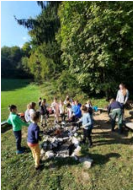
Drugošolci v šoli v naravi, Dolenja vas pri Čatežu

Za učence 2. razreda bomo izvedli Tematski teden: Gozd – prostor doživetij, v CŠOD Čebelica, in sicer od 21. 10. 2024 do 23. 10. 2024 (2 oddelka) ter od 23. 10. 2024 do 25. 10. 2024 (2 oddelka).