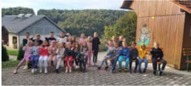
Šola v naravi, 2. razred

Šola izvaja del obveznega programa in drugih dejavnosti kot šola v naravi. Šola v naravi je organizirana oblika vzgojno-izobraževalnega dela, ki poteka strnjeno tri ali več dni izven prostora šole. Za učence, ki se šole v naravi ne udeležijo, osnovna šola v tem času organizira primerljive dejavnosti.