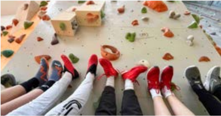
Sedmošolci v šoli v naravi, Gorenje