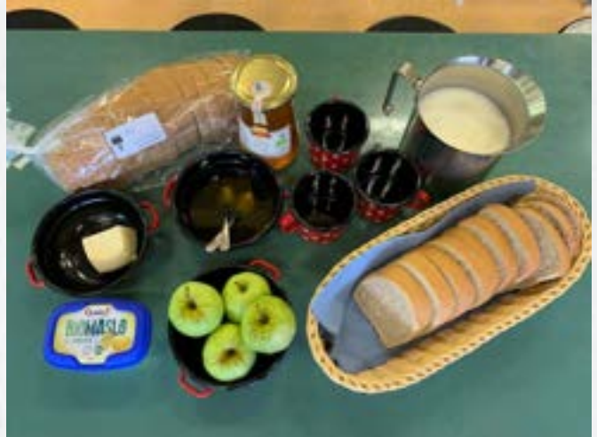
Tradicionalni slovenski zajtrk

Šolsko prehrano vodimo sami. MVI nam v skladu z normativi finančno pokrije 2,65 kuharja ter Občina Jesenice 0,43 kuharja oz. kuhinjskega pomočnika. Ostalo financiramo sami iz lastnih sredstev. Na šoli vsakodnevno pripravimo malice in kosila. Poleg tega učencem, ki so v jutranjem varstvu, vsakodnevno postrežemo enostaven prigrizek in topel napitek. Za učence z alergijami, intolerancami, sladkorno boleznijo in drugimi zdravstvenimi težavami pripravljamo tudi dietne malice in kosila.