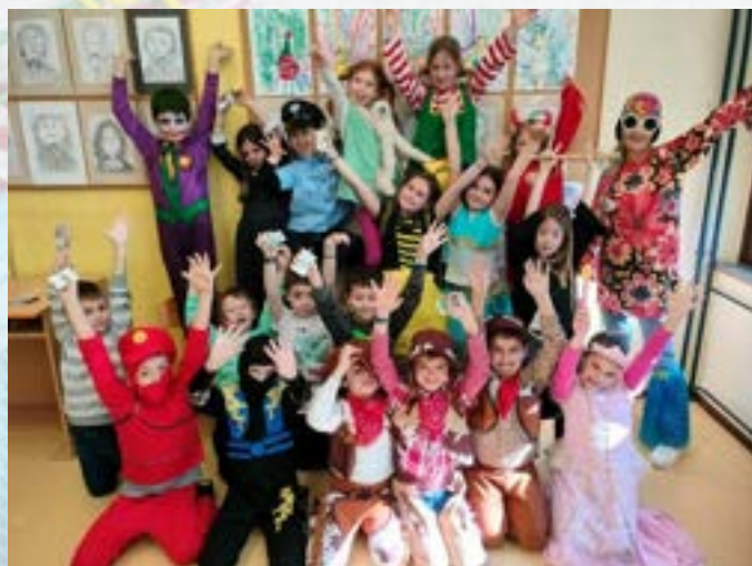
Pust v šoli

Na dodatnem pouku se učenci pri nekaterih predmetih pripravljajo tudi na tekmovanja.