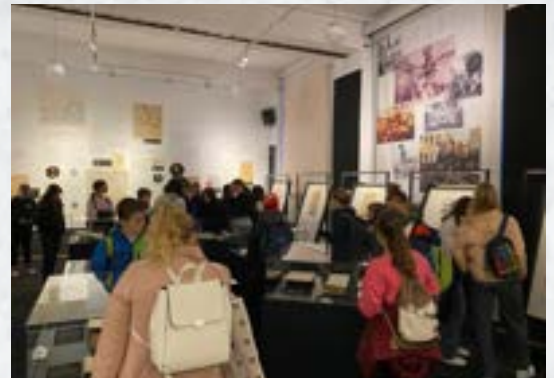
Obisk NUK in knjižnega sejma

Od 4. do 6. razreda se učenci vključujejo v neobvezne izbirne predmete.