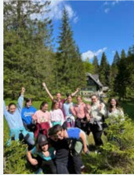
Tabor za nadarjene učence v Kranjski Gori

Na vsaki stopnji pomoči je potrebno ukrepe načrtovati, evidentirati in evalvirati. V drugem koraku je potrebno pridobiti tudi pisno soglasje staršev. Šola se zaveda svoje strokovne odgovornosti do učencev z učnimi težavami. Učence in njihove starše skuša opolnomočiti, da bi tudi sami prevzeli svoj del odgovornosti za uspešnost. Pri obravnavi učencev se trudimo, da bi pristopili k težavam čim bolj celostno in učinkovito. Na posameznih stopnjah pomoči je potrebno veliko medsebojnega sodelovanja med posameznimi strokovnimi delavci in zunanjimi strokovnjaki. Individualno in skupinsko učno pomoč nudijo strokovni delavci v skladu s tedensko razporeditvijo ur.