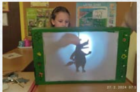
Ustvarjanje v 1. razredu in podaljšanem bivanju