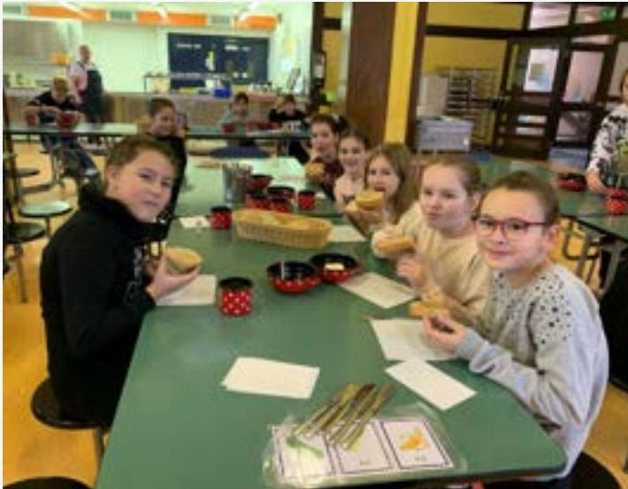
Učenci pri tradicionalnem slovenskem zajtrku

Poskušamo se čim bolj držati smernic zdravega prehranjevanja (z letošnjim šolskim letom so stopile v veljavo nove), vendar obenem pazimo, da pri jedi nastane čim manj odpadkov, zato seveda upoštevamo tudi, kaj učenci jedo.