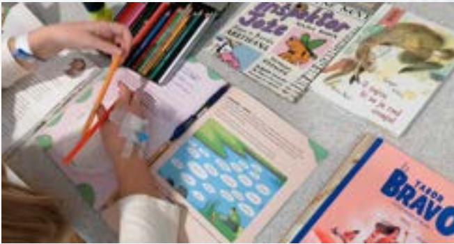
Pouk v bolnišničnem oddelku Splošne bolnišnice Jesenice

Že nekaj let uspešno izvajamo vzgojno-izobraževalno delo na otroškem oddelku Splošne bolnišnice Jesenice. Na tem oddelku pouk in druge aktivnosti izvajata dve učiteljici. Bolnišnični oddelek se povezuje z drugimi oddelki po Sloveniji. Po potrebi učiteljici vzpostavljata stike s šolami, od koder prihajajo otroci, predvsem ko gre za dolgotrajno bolne otroke.