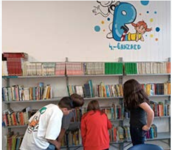
Pouk v knjižnici

Uporabniki do konca šolskega leta v knjižnico vrnejo vse gradivo. Kdor zamuja z vračanjem gradiva, si novega ne more izposoditi. Uporabniki so dolžni upoštevati pravila Knjižničnega reda.