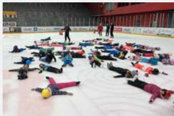
Projekt Gremo drsat