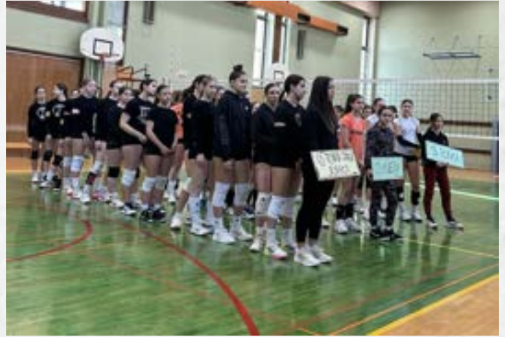
Državno prvenstvo v odbojki na Osnovni šoli Toneta Čufarja Jesenice