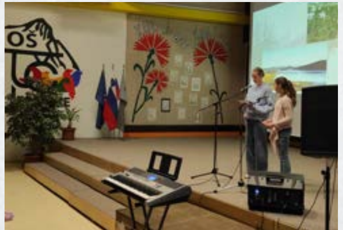
Proslava ob Prešernovem dnevu, slovenskem kulturnem prazniku