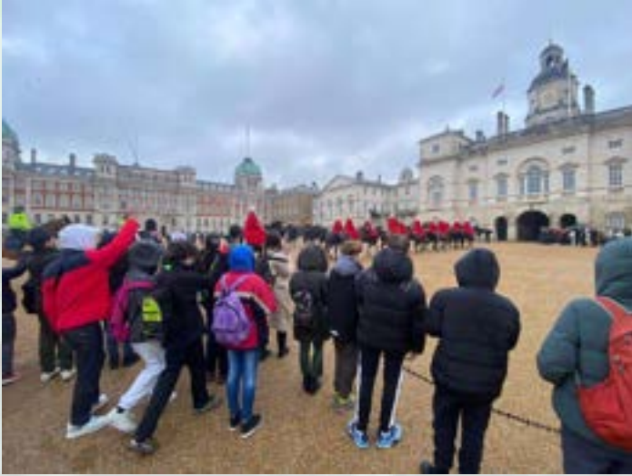
Strokovna ekskurzija v London