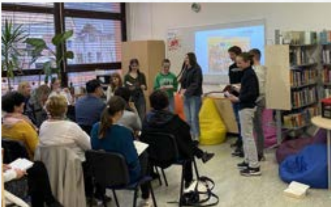
Odprtje šolske knjižnice