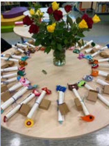
Odprtje šolske knjižnice

Naloge, ki jih opravlja Svet staršev so določene s 66. členom Zakona o organizaciji in financiranju vzgoje in izobraževanja .