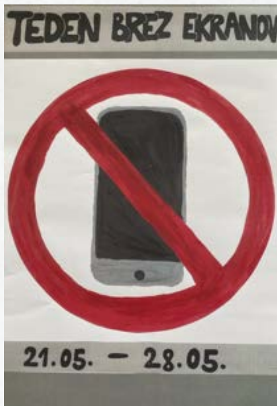
Teden brez ekranov, projekt šolske skupnosti učencev