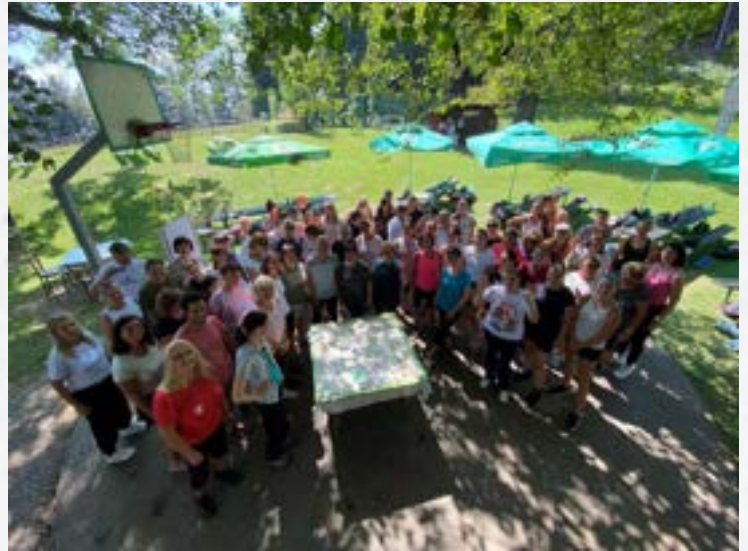
Poglabljanje timskega sodelovanja, avgust 2024

Sestavljajo ga strokovni delavci, ki opravljajo vzgojno-izobraževalno delo v posameznem oddelku. Obravnava učno in vzgojno problematiko v oddelku, oblikuje program dela z nadarjenimi učenci in s tistimi, ki potrebujejo pomoč, odloča o vzgojnih ukrepih ter opravlja druge naloge v skladu z zakonodajo.