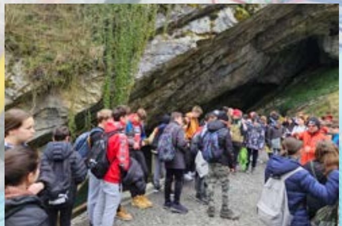
Osmošolci na dnevu dejavnosti na Notranjskem