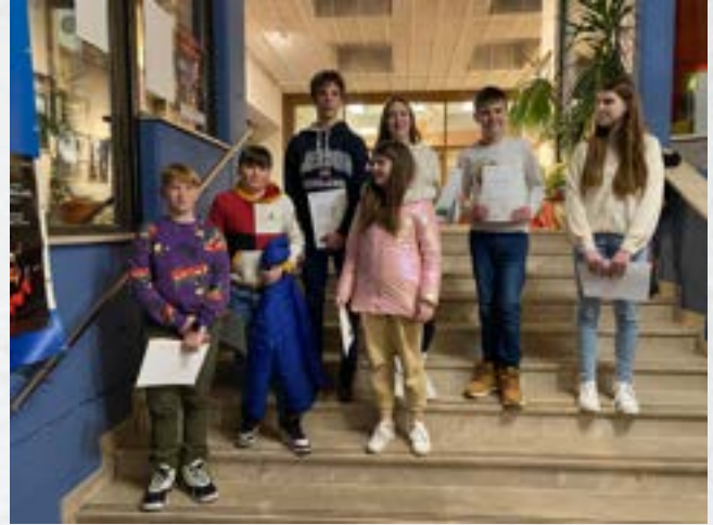
Naši učenci na tekmovanju Kaj veš o zgodovini mesta Jesenice

Za devetošolce lahko dosežek iz matematike in slovenskega jezika na NPZ pomeni tudi del merila za vpis v srednjo šolo ob morebitni omejitvi vpisa.