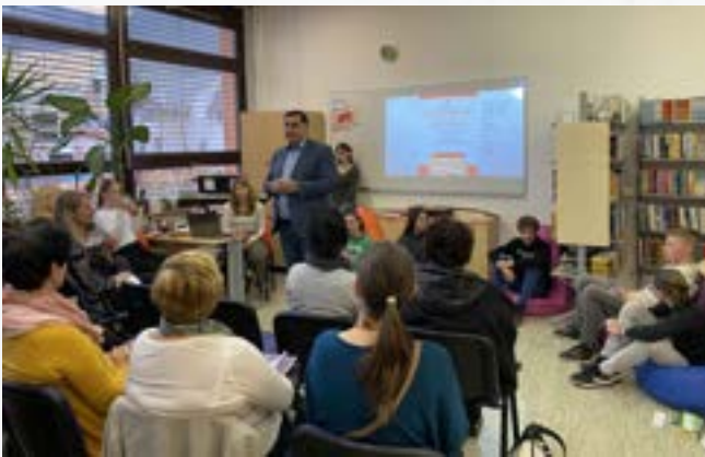
Odprtje šolske knjižnice

Ustvarjanje spodbudnega učnega okolja za vse učence je eden od elementov sodobne in hkrati inkluzivne šole 21. stoletja. Proces učenja, učenčeva samopodoba, znanje, spodbudno učno okolje, kreativnost – vse to so stvari, ki zelo vplivajo na življenje in delo v šoli. Šolski prostori naj bi bili takšni, da se bodo učenci in zaposleni dobro počutili, saj bodo pri svojem delu posledično bolj uspešni in ustvarjalni.