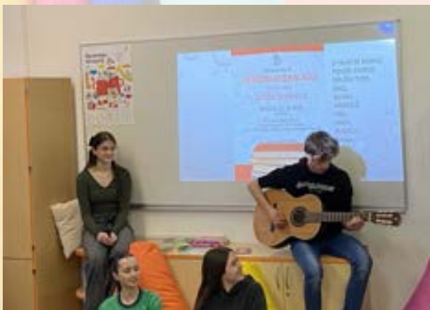
Odprtje šolske knjižnice

Nova šolska knjižnica je postala prostor ne samo za izposojajo knjig, temveč tudi prostor za srečevanje, pogovor, druženje ob različni literaturi, prav tako pa kotiček za zabavo in druženje. Učencem je v knjižnici všeč tišina, da lahko berejo ali pregledujejo gradivo, včasih tudi skupaj s prijatelji, nekateri počakajo na izbirni predmet, pridejo pregledovat revije iz čitalnice. Po prvotnem načrtu nam je uspela selitev v nove prostore, opremili smo kotičke za branje in srečevanje ter čitalniški del za mladino in strokovne delavce.