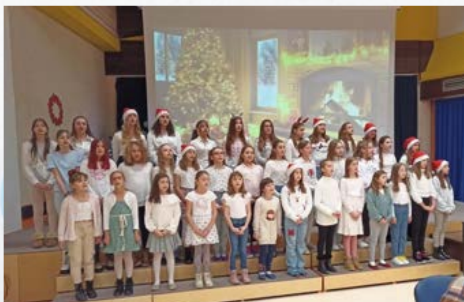
Nastop pevskega zbora na srečanju starejših občanov Jesenic