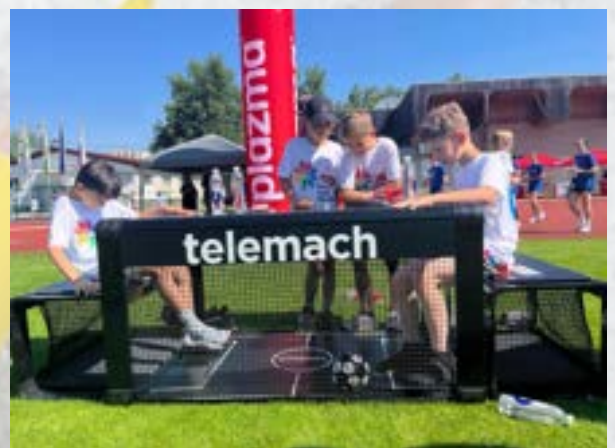
Športne igre mladih