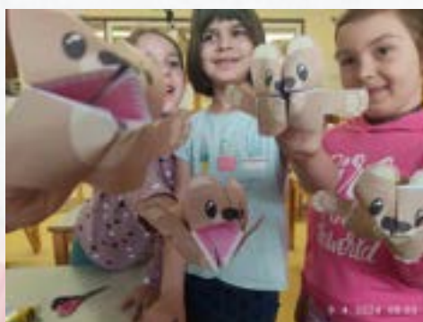
Ustvarjalne lutkovne delavnice