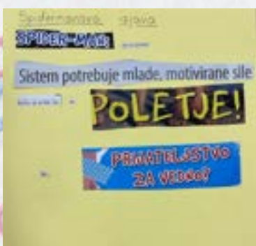
Ustvarjanje konsov, Noč knjige