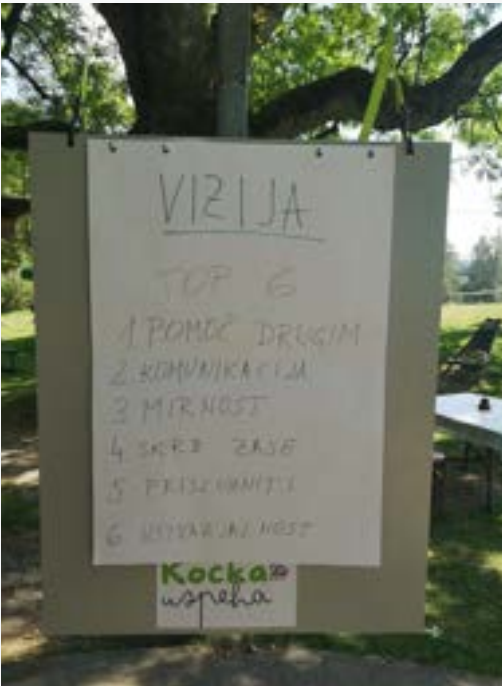
Poglabljanje timskega sodelovanja, avgust 2024