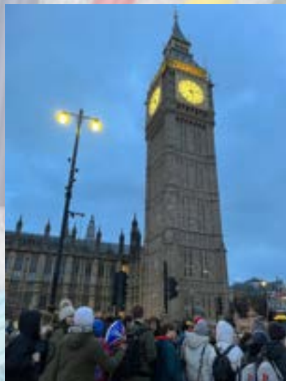
Ekskurzija v London