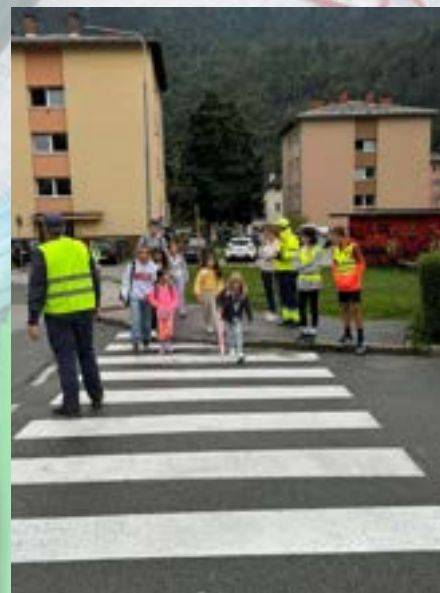
Varnost v prometu - devetošolci pomagajo mlajšim