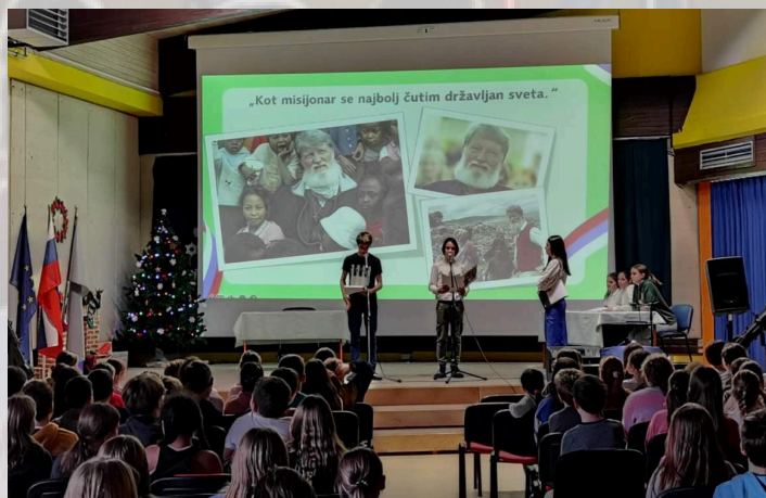
Proslava ob dnevu samostojnosti in enotnosti