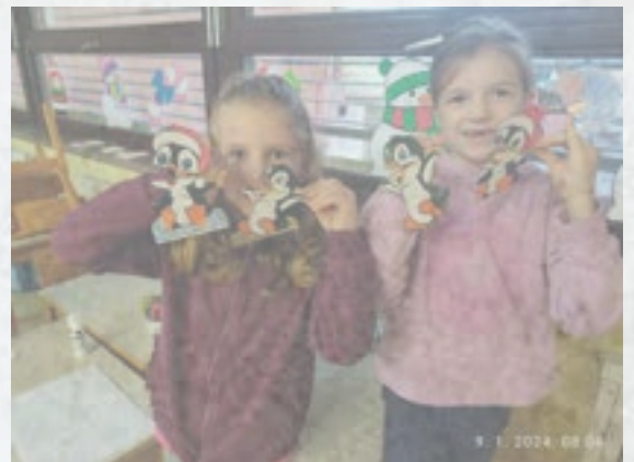
Ustvarjanje v 1. razredu in podaljšanem bivanju

Učenci iz podaljšanega bivanja odhajajo ob določenih urah, in sicer: po kosilu, ob 13.00, 13.30, 14.00, 14.30. Po 15.00 lahko učenec odide, kadarkoli želijo starši. S to spremembo smo izboljšali delo učencev in učiteljev v podaljšanem bivanju, saj je čas lahko namenjen bolj strukturiranemu preživljanju časa in izvajanju različnih dejavnosti (različna ustvarjanja, gibalne minute, sprehodi, delo domače naloge ...).